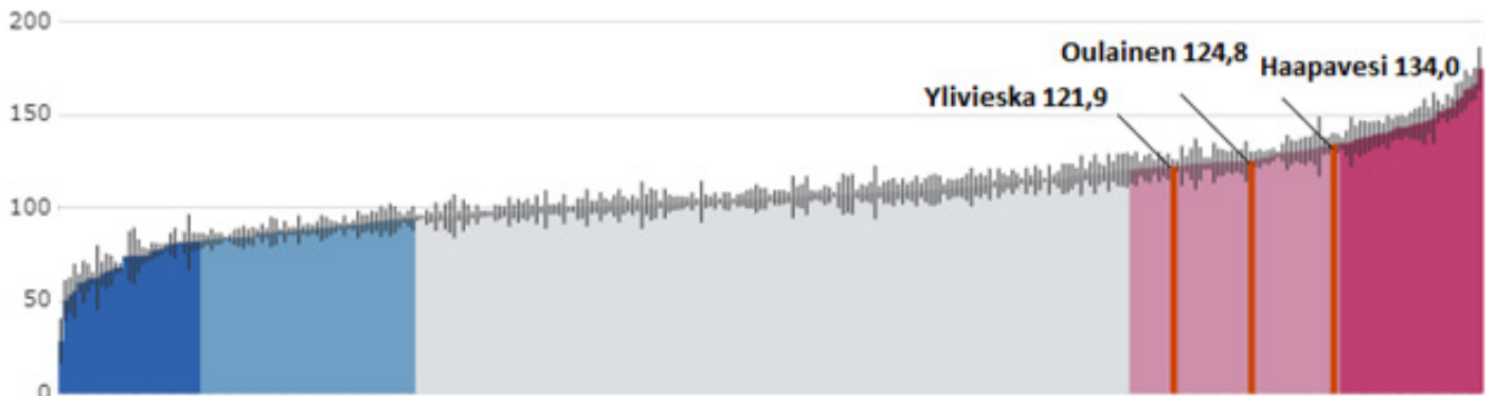
Kuva 1. THL:n ikävakioidu sairastavuusindeksi 2019. Vertailussa Oulainen, Ylivieska ja Haapavesi.

sairauksien, muistisairauksien, masennuksen ja useiden syöpäsairauksien ehkäisyyn, hoitoon ja kuntoutukseen (Duodecim 2016).