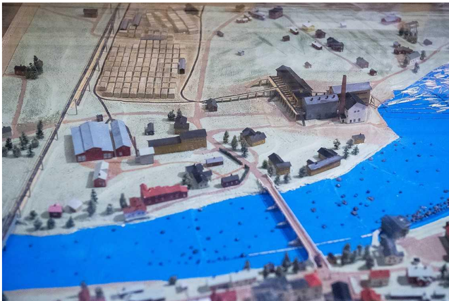
Oulaistenkosken saha-alue vuonna 1950.