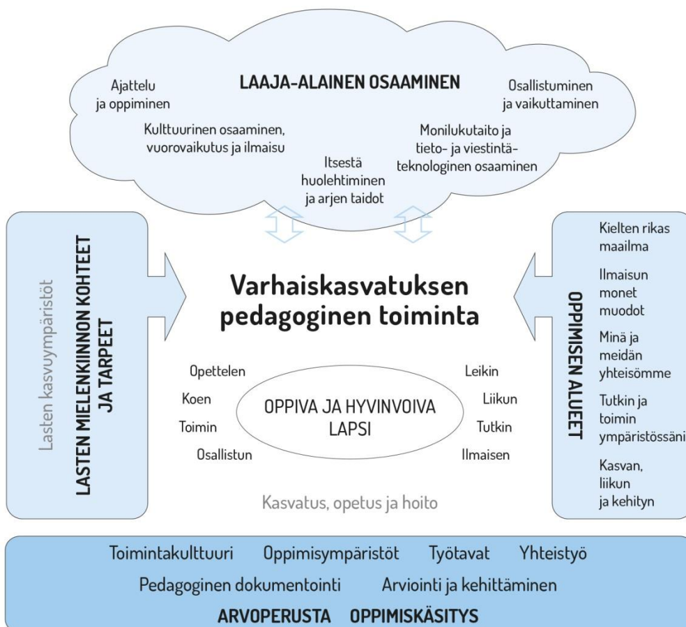
Kuvio 1. Varhaiskasvatuksen pedagogisen toiminnan viitekehys

Varhaiskasvatuksen pedagogista toimintaa ja sen toteuttamista kuvaa kokonaisvaltaisuus. Tavoitteena on edistää lasten oppimista ja hyvinvointia sekä laaja-alaista osaamista (kuvio 1). Pedagoginen toiminta toteutuu lasten ja henkilöstön välisessä vuorovaikutuksessa ja yhteisessä toiminnassa. Lasten omaehtoinen, henkilöstön ja lasten yhdessä ideoima sekä henkilöstön johdolla suunniteltu toiminta täydentävät toisiaan. Varhaiskasvatuksen pedagoginen toiminta läpäisee kasvatuksen, opetuksen ja hoidon kokonaisuuden.